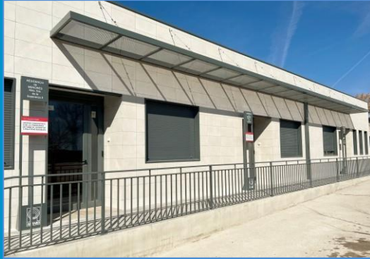
“APANID Ntra. Sra. de la Esperanza II” A.P.A.N.I.D.

Complejo Asistencial "Prado Acedinos" Ctra. Toledo, Km. 16,400 Paseo de Tiselius, 9 28906 - Getafe - Madrid Teléfonos: 916815511/615622681 Fax: 916 815 561 residencianse2@apanid.es www.apanid.es