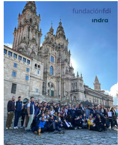
Camino de Santiago.

Este año hemos contado entre otros, con la colaboración de: Decathlon, Fundación Solidaridad Carrefour, Fundación Seur, Fundación Getafe CF, Escuela Patinando, Sould Wheel, Ericsson, Colegio de los Ángeles, Airbus, FDI, Ecoherencia, Tecnocasa, Fundación Real Madrid, Indra, Randstad, L'Oreal, La Caixa, Arue Capoeira, Scor, Allianz, Iberdrola, Hakuna Ma Samba.