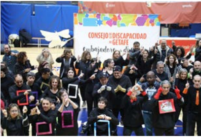
Gala de los Abrazos - Día Internacional de las Personas con Discapacidad.

S eguimos sumando esfuerzos para lograr una sociedad inclusiva, en el que todos y todas podamos participar en igualdad de condiciones, en la vida política, cultural y social, de nuestra comunidad.