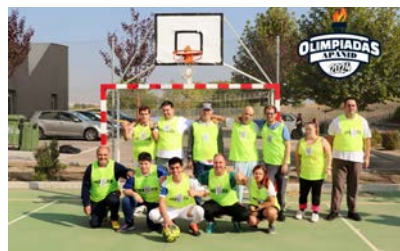
29 Olimpiadas APANID.