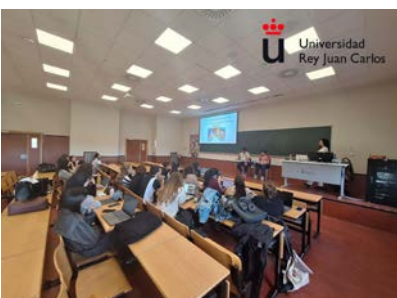
Jornada Educativa - Universidad Rey Juan Carlos I - Alcorcón.