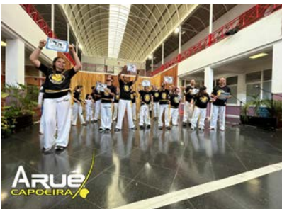
II Festival de Capoeira Inclusiva.