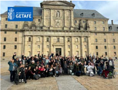
Encuentro de Entidades del Consejo.