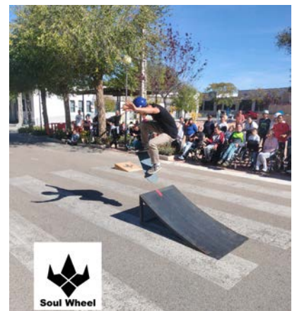
Jornada de Patinaje con SOULD WHEEL.