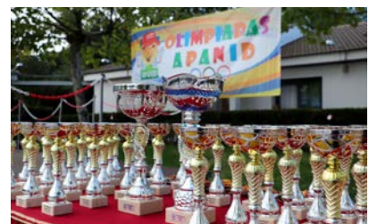
Entrega Trofeos Olimpiadas APANID.