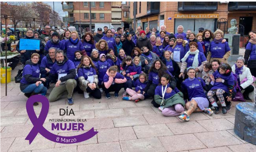
Acciones por el 8 de Marzo - Consejo de la Mujer - Ayto. de Getafe.