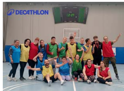
Jornada Baloncesto - Decathlon.