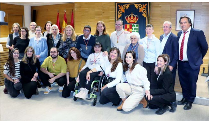
Ayto. Getafe - Concejales por un día.