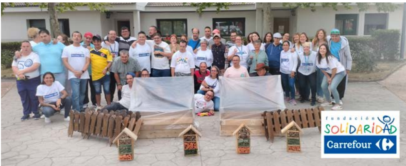
Evento Voluntariado Carrefour.