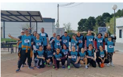
Jornada deportiva con el colegio Los Ángeles.