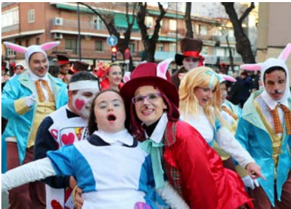
Carnaval Getafe 2024.