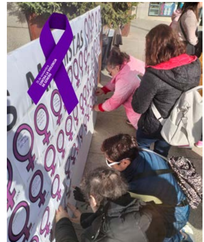
Acciones por el 25 de Noviembre - Consejo de la Mujer - Ayto. de Getafe.