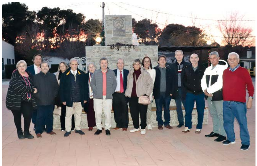
Junta Directiva de la Asociación APANID 2024-2025.

También hay otras acciones por parte de la Comunidad de Madrid (Consejera de Fami-