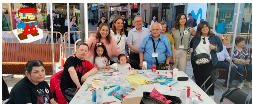
Encuentro en 3D - Consejo de la Discapacidad - Ayto. Getafe.