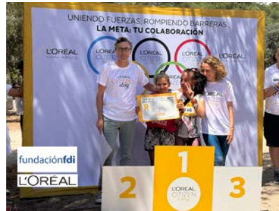
Jornada Deportiva L'OREAL.